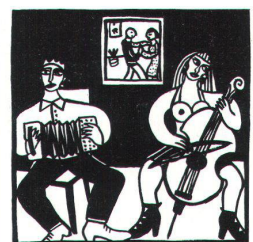
Illustrationen im Kalenderteil von Lea Huber